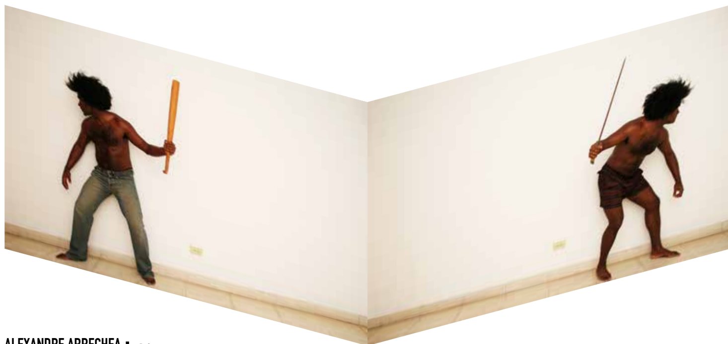
ALEXANDRE ARRECHEA ■ Cuba White Corner