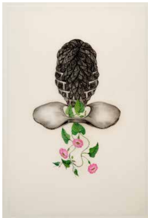
JOSCELYN GARDNER ■ Barbade/Canada

Installation, bouteilles, tissus, 2009 Dimensions variables Collection de l'artiste